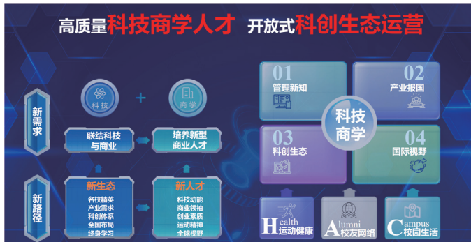
科技商学人才培养

哈尔滨工业大学商学院成立于 2022 年 7 月，代表学校统筹建设及运营 MBA、EMBA、MPAcc、MF、MEM 专业学位项目，以及经管商文、设计类同等学力项目，促进一校三区经管类学科融合发展。商学院积极落实学校新百年目标，培养“科技商学”人才，探索新型科创商学生态，激发孵化产业科技动能，助力助推企业壮大转型。