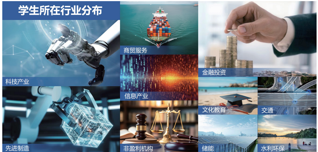
学生所在行业分布

学生来自于各行各业，分布在科技、先进制造、金融投资、文化教育、交通、储能、信息、商贸服务等行业，广泛就业于世界 500 强，中高层占比 80% 以上。