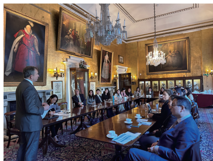
全球课堂——伦敦路线