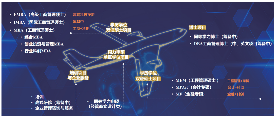
融合“科创”与“金融”的项目体系

商学院打造融合“科创”与“金融”特色的项目体系。包含博士项目、学历学位双证硕士项目、同等学力申硕单证学位项目、培训项目等。学院运营“青年科创”实践活动品牌，包括院士讲堂、青年科创行/科创营、名师讲坛、行业科创论坛、项目路演/沙龙等，旨在为学院学生和校友提供学习、交流、实践的综合性平台，2023 年在全国举办科创实践活动 120 余场。