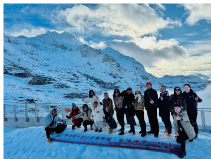
全球课堂——瑞士路线

名师，为学生扩展行业深度；学院聘请 120 余位头部科技公司、金融机构创始人及高管组成科创导师，带领学生联结产业前沿。